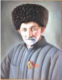
ЖУВАН ХАЛКЪДИЗ, ЖУВАН НАМУСДИЗ ХЪИЗ, ВАФАЛУ ЖЕН...