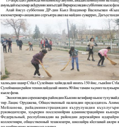
Халқини шаир Сўлайм Сулейман хайкали...