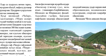
Баркалд тарих авай хур

Баркалд тарих авай хур. Баркалд тарих авай хур. Баркалд тарих авай хур.