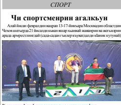
Российские и азербайджанские спортсмены на награждении в Агдаме.

равно 14 таких случаев. В их числе сунные горох и фасоль, семена люцерны для посева, а также нута, укроп, листья салата и абхоти. На первоначальный груз владельцы не имели фото-санитарных сертификатов, свидетельствующих о состоянии растениеводческой продукции. Помимо того по результатам карантинного фитосанитарного контроля продукции выписаны карантинные сертификаты: амброзия полярная и гортяк ползучий, калифорнийская шюттея, повилка и паслен кичовый.