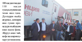
Вывеска фоторий кылеуи