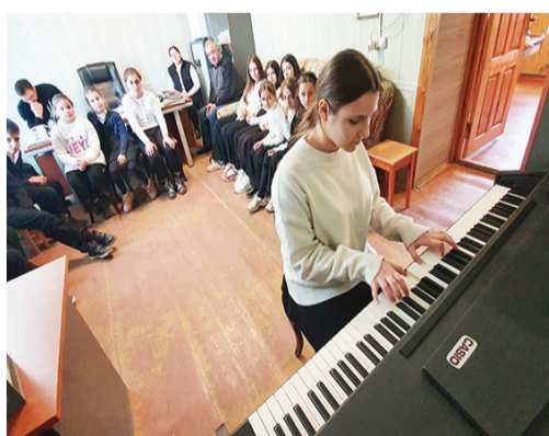
Мярекат тешкилувилелди кыле фена.

тербиячийри Мурад Кажлаеван музыкадин эсерар тамамарна. Абурун арада «Имам Шамиль» балетдай къачунвай, гъакIни симфониядин «Сентиментальный романс», «Танец девушек», «Прелюдия для виолончели» ва маса музыкадин эсерар авай.