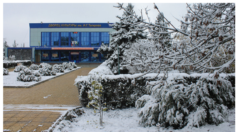
Кьасумхуьрел мукьвара, Сифте сефер жив кьвана, Хуььрез-кьугъваз аялар, Абурузни лап шад хъана.