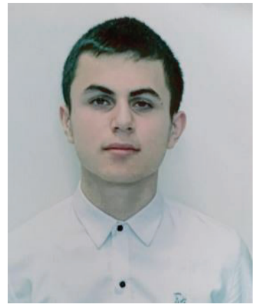
Хазран Кьасумов Шкилда: Л. Ражабов

Л. Ражабоваз школада руководстводин, муаллимрин ва келзавайбурун патай гуьрмет ава.